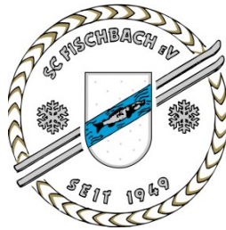
SC-Fischbach Ausweichtermin 20.01.17